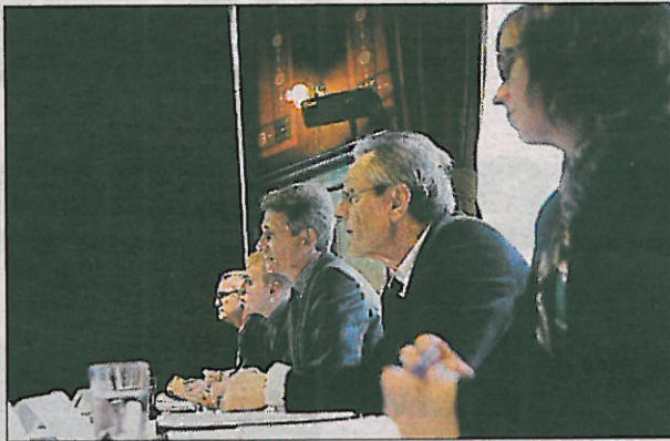
Juryn lyssnade koncentrerat på finalisternas redovisning om sina företag och varför de vill ha designhjälp.